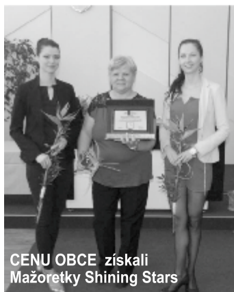
CENU OBCE získali Mažoretky Shining Stars