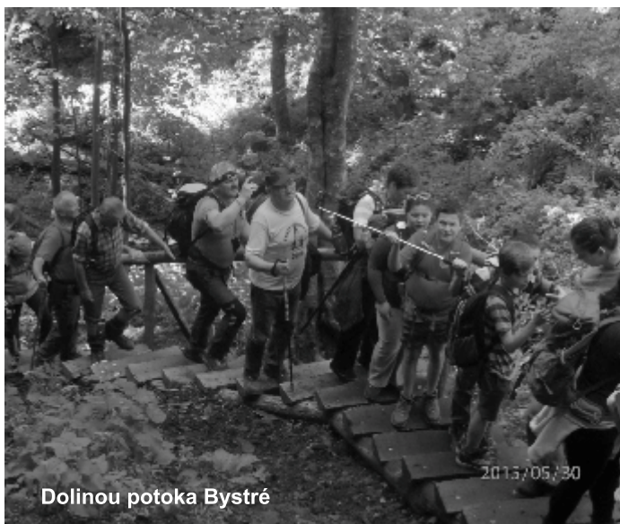
Dolnou potoka Bystré

Týždeň po výstupe na Poľanu sme už stavali stanový tábor na prakovsko-medzevskom poľmezi, t.j. na Trohanke – Dekungoch na upravenej a pokosenej lúke, aby sme si spoločne s našimi a medzevskými deťmi oslávili ich sviatok MDD. Mládež sa tešila na pripravené súťaže, odmeny, sladkosti a, samozrejme, na guláš i na večer s gitarou pri ohni. V nedeľu na raňajky už tradične praženica zo 120 vajec. K zdarnému priebehu celého pobytu v prírode prispelo po oba dni slnečné a teplé počasie bez mráčika. Aj noci boli teplé a mesiacom osvetlené. A hoci rekord v počte postavených stanov teraz nebol preknaný, bolo ich 26 a v nich približne 80 účastníkov – turistov vrátane mládeže. Všetko vyšlo podľa našich predstáv. Oneskorení okorenili náš pobyt v prírode nočným výstupom do tábora. Už teraz sa tešíme na najbližšie oslavy MDD v prírode v roku 2016.