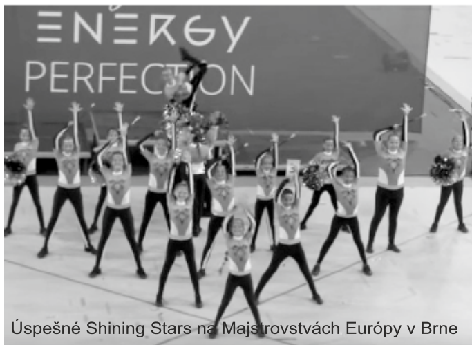
Úspešné Shining Stars na Majstrovstvách Európy v Brne