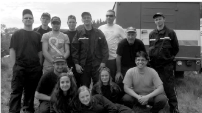
Súťaž Smolník 2 DHZ 2015