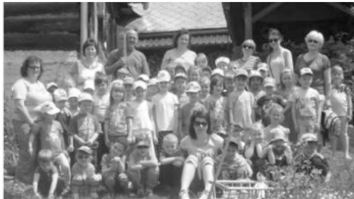
Výlet do Brutoviec