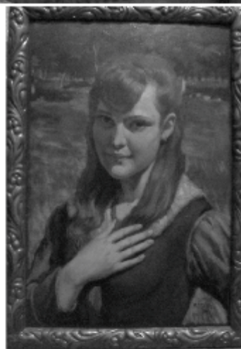
Portét neznámej dievčiny