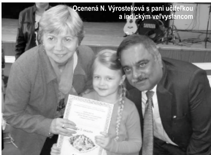
Ocenená N. Výrosteková s pani učiteľkou a indickým veľvyslancom

sú zručné, zdatné, šikovné a pre každého súťažiaceho bola pripravená pekná odmena. Počasie bolo priaznivé a deti spokojné.