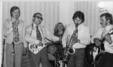
Muzikanti si vymenili svoje tradičné hudobné nástroje

Sedemdesiate roky dvadsiateho storočia boli priaznivo naklonené rozvoju masovej záujmov-