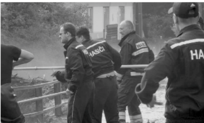
Záchranné práce pri rozvodnenom Hrelikovom potoku, júl 2015