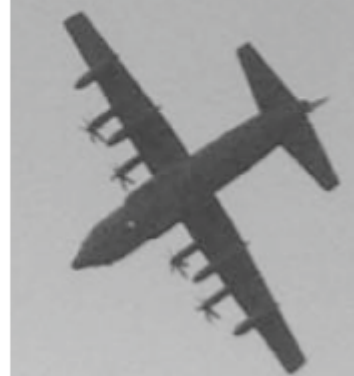
Herkules zachytený mobilom (Michal Grančaj)

V dňoch 9. – 11. 8. 2015 vyrušilo ľudí obrovské lietadlo, ktoré prelietavalo veľmi nízko, vraj len niekoľko sto metrov nad zemou. U mnohých to vzbudzovalo strach. Nebol ale dôvod k panike. Išlo o obrovský štvormotorový stroj - Hercules C – 130, americké lietadlo, ktoré nad naším územím vykonávalo nácvik. Podľa oficiálnych zdrojov prelet lietadla nad územím SR bol súčasťou vopred plánovanej a dlhodobé riadne koordinovanej výcvikovej aktivity spojeneckých vzdušných síl.