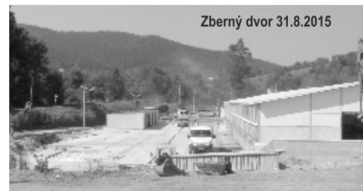
Zberný dvor 31.8.2015

Komunitné centrum v obci už pracuje, ale bytový dom č. 278