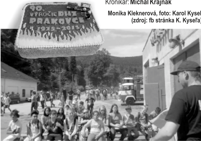
Deň detí v hasičskej zbrojnici

Monika Kleknerová