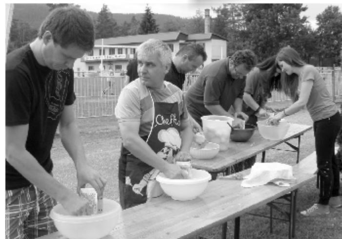
Tradičná PRAKOVSKÁ PLACKA vzišla z rúk členov KST Prakovce