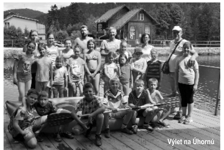
Výlet na Úhornú