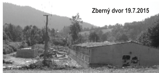
Zberný dvor 19.7.2015

V zmysle zákona o odpadoch má obec povinnosť umožniť občanovi odovzdať odpad. Doposiaľ sme odpady od občana odoberali len prostredníctvom staničiek komunálnych odpadov (zmesový komunálny odpad), kontajnera na stavebné odpady a kontajnera na veľkoobjemový odpad (oba umiestnené za nákupným strediskom) a zelený odpad odvozom vlastným nákladným komunálnym vozidlom priamo od občana. Nebezpečný odpad sme odoberali od občanov dvakrát ročne prostredníctvom kontajnera na nebezpečné odpady. Spustením do prevádzky zberného dvora sa bude meniť doterajší systém nakladania s komunálnymi odpadmi (ďalej KO). Zmesový KO sa bude aj naďalej odberať od občanov prostredníctvom zberných nádob, ktoré sú v každom rodinnom dome a na sídliskách sú kontajnerové nádoby v staničkách KO. Separované zložky KO sa budú od občanov aj naďalej odberať systémom vriec, resp. nádob na separovaný odpad. Zložky odpadov, ako sú veľkoobjemový, nebezpečný a stavebný odpad, sa budú odberať v areáli zberného dvora v zmysle určeného prevádzkového poriadku. V zbernom dvore sa bude nachádzať traktor s vlečkou