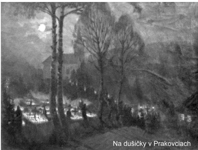
Na dušičky v Prakovciach