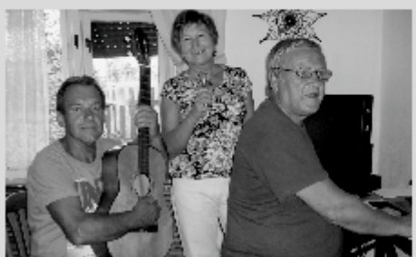
Stretnutie u kapelníka v lete 2015